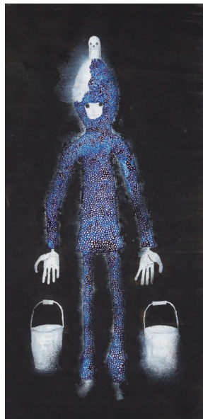
『Be kind and have the courage.Heaven 2020』