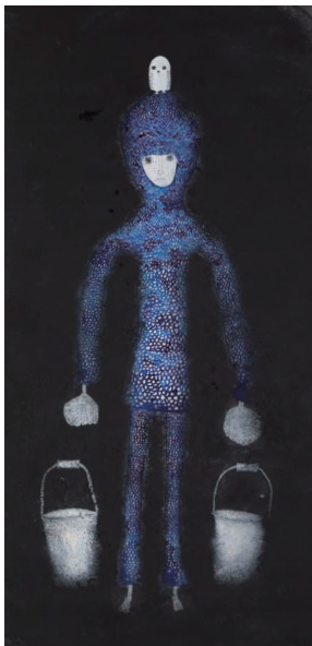
『Be kind and have the courage.Earth 2020』