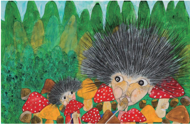
『ばあちゃんがいる』伊藤比呂美 文/MAYA MAXX 絵 (福音館書店 2019年)より 今治市河野美術館 〒794-0042 今治市旭町 1-4-8