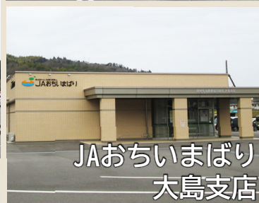
JAおちいまばり大島支店