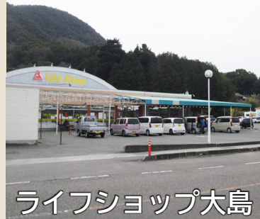
ライフショップ大島