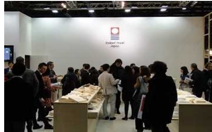
マチェフ展の出展状況