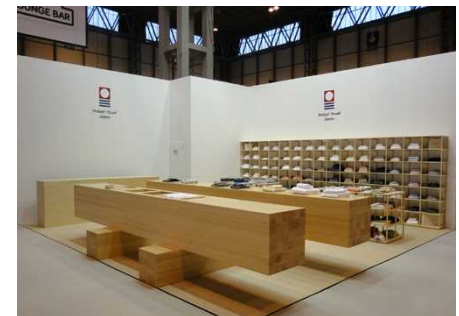
出展状況:スプリングフェア