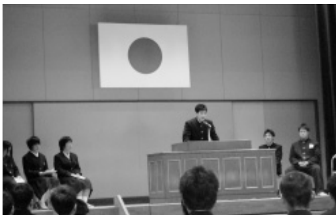
地域社会、日本、世界、そして自分のことについての 議論大会(伯方高校)