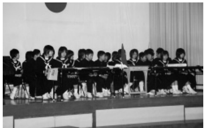
生徒の感性・個性が光った俳句ライブ(西伯方中学校)