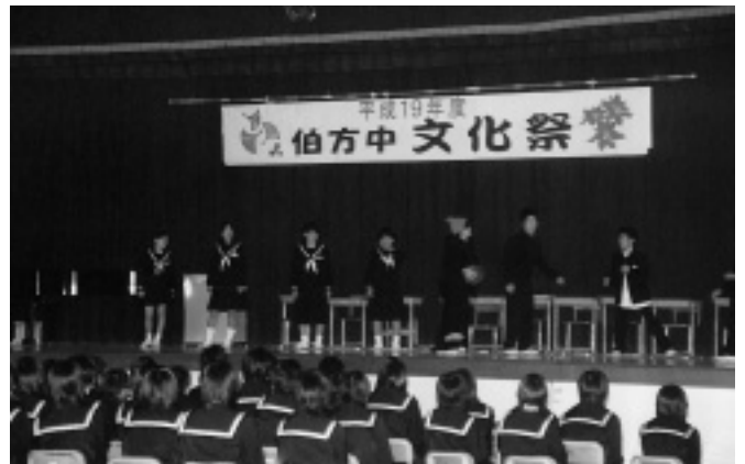
お互いの人権の大切さを訴えた人権劇(伯方中学校)

伯方中学校は「The final school festival ぼくのわたしの伯方中学校」、西伯方中学校は「青春 輝け! 西中文化祭 ～感動をわかちあおう～」をテーマに人権劇や合唱、句会ライブなどを行い、最後の熱い文化祭となりました。