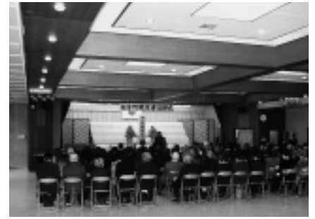
不戦の誓いを新たにした追悼式 (伯方公民館大ホール)

式では日之西支所長が市長の式辞を代読した後、遺族全員が献花をして戦争のない平和な社会をつくっていくことを誓いました。