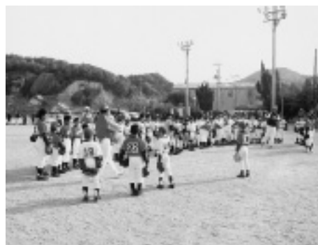
【上】4本の優勝旗を持つ伯方マリズ 【左】愛媛MP選手の指導を受ける少年選手たち