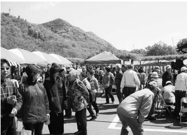
今年も多くの方が来場されました