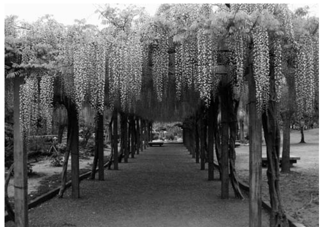
ゴールデンウィーク明けには藤は満開