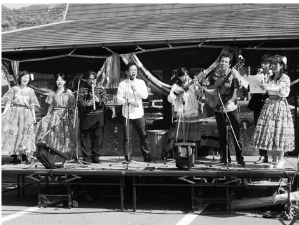
会場に来られた皆さんで「みかんの花咲く丘」を歌いました