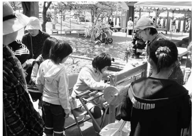
今年も大人気のさをり織り体験