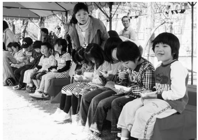
上手にお作法できたかな