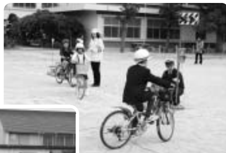
自転車の交通ルール、覚えられたかな