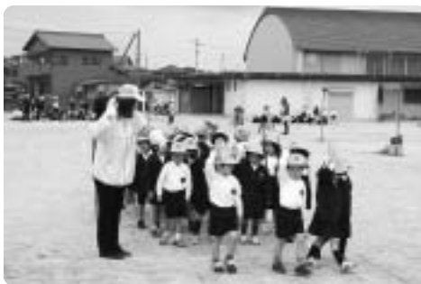
横断歩道は手を上げて渡ります