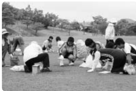
みんなで楽しく草引き