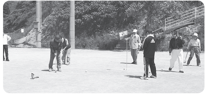
一打一打が真剣です

5月30日(日)、緑の広場公園多目的グラウンドで菊間グラウンドゴルフ大会が開催されました。