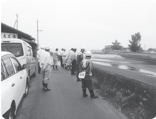
危険箇所の調査を行う参加者

策強化月間中に県や市の防災担当職員、警察、消防関係者が合同で毎年、現地調査しているものです。