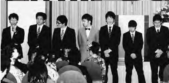
新成人全員が近況や将来の夢などを発表