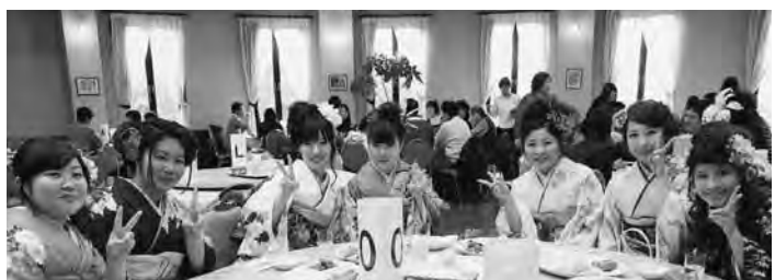
晴れ晴れとした笑顔でピースサイン

式典後は、おしゃべりをしたり、記念撮影をしたりで終始和やかな雰囲気の中、思い出話に花を咲かせながら、新しい思い出を刻むように旧友たちとの時間を過ごしていました。