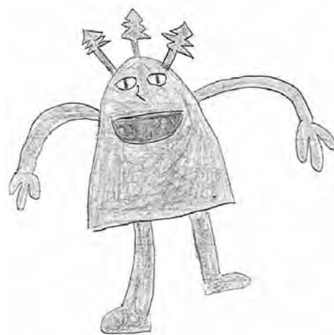
やま くら 山倉みどり