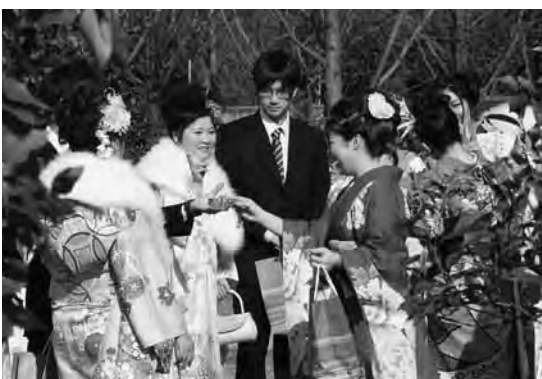
久しぶりの再会に笑顔を見せる新成人