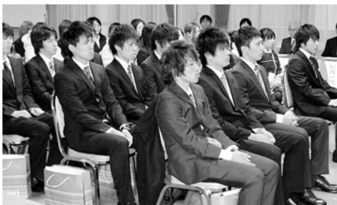
少し緊張の面持ちの新成人