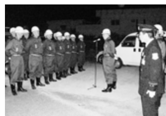
今治市消防団 かん 管団長巡視

昨年の、12月25日(日)から30日(金)まで、消防団による年末夜警が実施されました。町内各地区で、団員が夜遅くまでパトロールを行うなど防火や防犯を呼び掛けました。