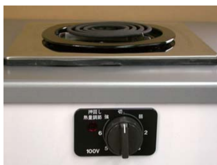
一口こんろ (前面操作) ※写真は富士工業製

身体や物が接触し、意図せずスイッチが「入」となる可能性がある構造であったために、電気こんろの上や周囲に可燃物が置かれていて、火災事故に至る危険性があります。