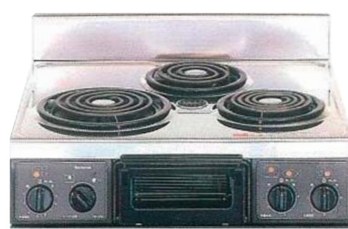
複数口こんろ (前面操作のみ)