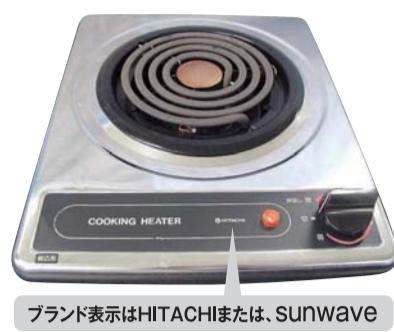
ブランド表示はHITACHIまたは、Sunwave