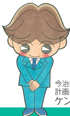
今治市健康づくり 計画推進キャラクター ケンちゃん