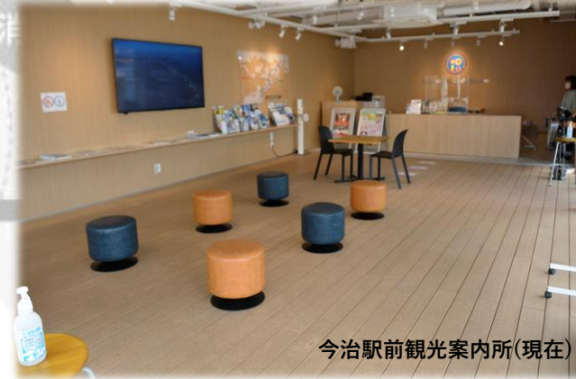
今治駅前観光案内所(現在)