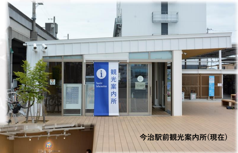
今治駅前観光案内所(現在)