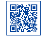
地域要件確認表(総務省)

https://www.soumu.go.jp/main_content/000847999.pdf