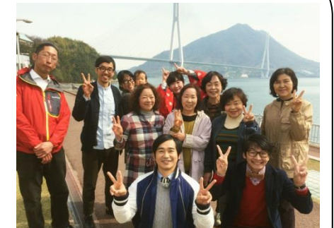
協力隊員・ハマカーンと地域の皆さん

温暖少雨、穏やかな気候は農業に適しており、昔から柑橘栽培が盛んに行われてきた地域です。近年は移住者が多く、主に有機栽培農業や特産品加工・販売に取り組みながら地域コミュニティに溶け込んでいます。また移住者の方々は歴代協力隊の良きお手本、相談相手になっています。アクセスも良く、日本古来の文化とバランスの取れた生活ができます。