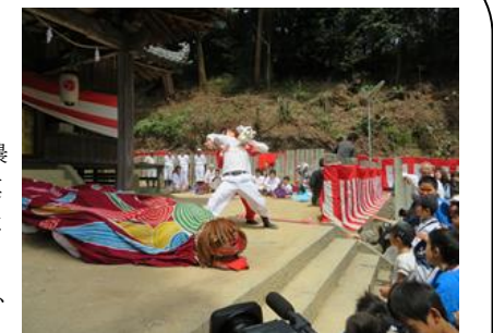
春の大祭で行われる「ニワカ芝居」

緑豊かな山々に囲まれ、米や梨などの美味しい農産物が獲れる里山地域です。また、県下最大規模を誇る古墳群や史跡が点在しています。近年では女子中学生のサッカー選手養成機関である「JFAアカデミー今治」が廃校舎を活用して整備され、地域住民の方々が活動のサポートに取り組んでいます。