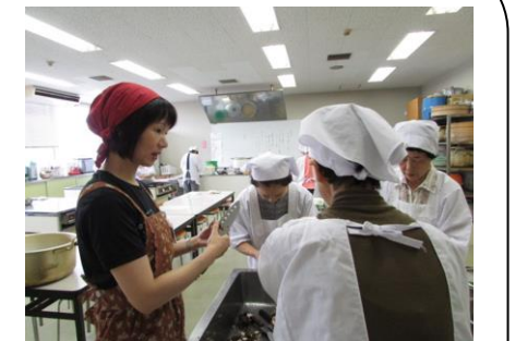
ボランティア配食サービス

三方を海に囲まれた高縄半島の先端部に位置し、海運・造船業、また漁業等の海に関連した産業が盛んな地域です。伝統芸能の「継ぎ獅子」も盛んで、各地域の春祭りなどで披露されています。