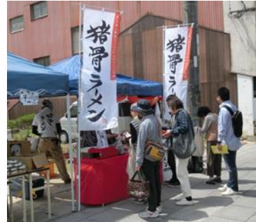
協力隊員が取り組む『豚骨ラーメン』

また、柑橘を中心とした農業や、造船、製塩などの製造業が盛んで、近年は有害鳥獣であるイノシシの駆除後の活用への取組も始まっています。