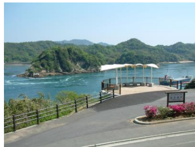
船折り瀬戸からの眺め

海運業と造船業の盛んな島として知られており、「伯方の塩」の発祥の地としても有名です。道の駅では農家の女性など住民有志が地産地消レストランを開業し、好評を博しています。道の駅の隣にはイルカとふれあえる施設も立地しています。また、開山の展望台からはしまなみ海道の橋や島が織りなす景観を一望できます。