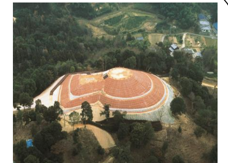
国指定史跡「妙見山古墳」

瀬戸内海に面した平野に位置し、造船業やタオル産業を中心に栄えてきた地域です。美しい海岸や砂浜は映画のロケに使われたことがあります。約1,700年前に造られた前方後円墳「妙見山古墳」は復元整備によりグッドデザイン賞を獲得。周辺は藤山健康文化公園として、住民の憩いの場となっています。