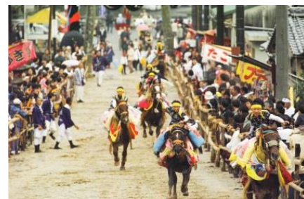
お供馬の走り込み

毎年1月に開催される「かわらぬ愛さくま」をはじめ、秋に開催される「お供馬の走りこみ」など各種イベントが盛んに行われています。