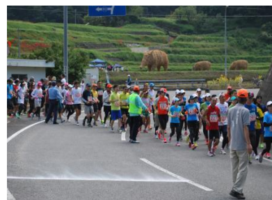
地域住民が作製したワラシシと鈍川渓谷グルメマラソン

美人の湯として知られる鈍川温泉や玉川ダム湖周辺は奥道後・玉川県立自然公園に指定されており、美しい景観が広がっています。地域住民が「ワラシシ」や「玉川ダムカレー」の作製や「鈍川渓谷グルメマラソン」を実施するなど、地域活性化を目指す取組を進めています。