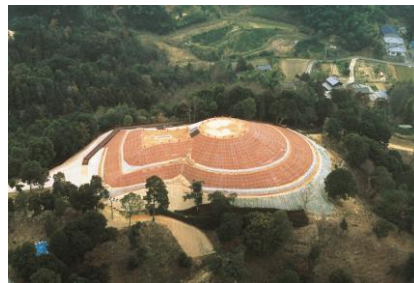
国指定史跡「妙見山古墳」

瀬戸内海に面した平野に位置し、造船業やタオル産業を中心に栄えてきた地域です。美しい海岸や砂浜は映画のロケに使われたことがあります。約1,700年前に造られた前方後円墳「妙見山古墳」は復元整備によりグッドデザイン賞を獲得。周辺は藤山健康文化公園として、住民の憩いの場となっています。