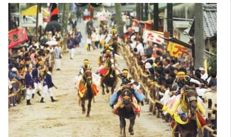
お供馬の走り込み

毎年1月に開催される「かわらぬ愛きくま」をはじめ、秋に開催される「お供馬の走りこみ」など各種イベントが盛んに行われています。