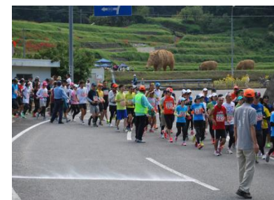
地域住民が作製したワラシシと鈍川渓谷グルメマラソン

美人の湯として知られる鈍川温泉や玉川ダム湖周辺は奥道後・玉川県立自然公園に指定されており、美しい景観が広がっています。地域住民が「ワラシシ」や「玉川ダムカレー」の作製や「鈍川渓谷グルメマラソン」を実施するなど、地域活性化を目指す取組を進めています。