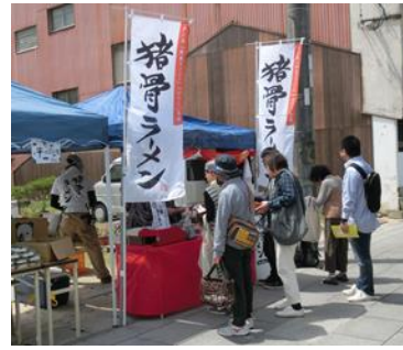
協力隊OBが取り組む『豚骨ラーメン』

また、柑橘を中心とした農業や、造船、製塩などの製造業が盛んで、近年は有害鳥獣であるイノシシの駆除後の活用への取組も始まっています。