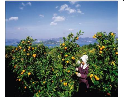
みかん栽培の風景

温暖少雨、穏やかな気候は農業に適しており、昔から柑橘栽培が盛んに行われてきた地域です。近年は移住者が多く、主に有機栽培農業や特産品加工・販売に取り組みながら地域コミュニティに溶け込んでいます。また移住者の方々は歴代協力隊の良きお手本、相談相手になっています。アクセスも良く、日本古来の文化とバランスの取れた生活ができます。