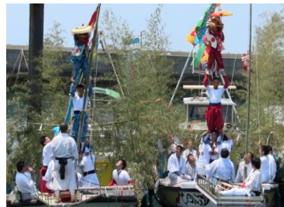
継ぎ獅子（船上継ぎ獅子）

三方を海に囲まれた高縄半島の先端部に位置し、海運・造船業、また漁業等の海に関連した産業が盛んな地域です。特に大角鼻は、斎灘と芸予諸島を一望にでき、海水浴やキャンプ、魚釣り等にぎわいます。伝統芸能の「継ぎ獅子」も盛んで、各地域の春祭りなどで披露されています。