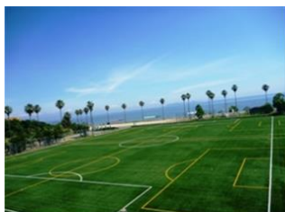
桜井海浜ふれあい広場サッカー場