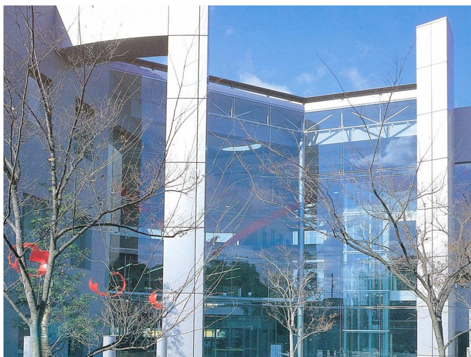
(今治市立中央図書館)