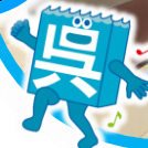
呉市公式キャラクター 「呉氏」