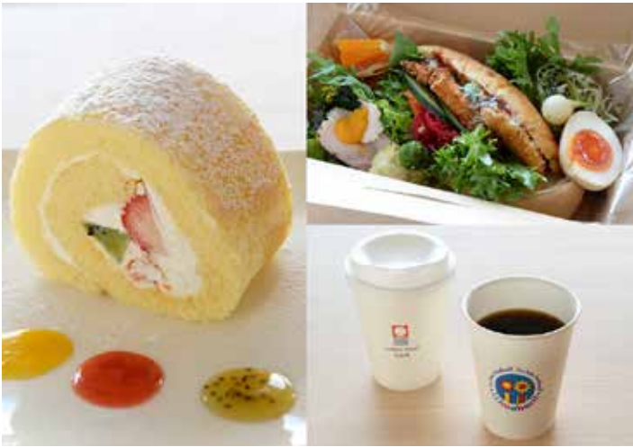
特別コラボメニュー

今治タオル工業組合初めての取り組みでもある「タオル×食」の異色コラボ、今後この場所からどんな交流が生まれ、どんなおもしろい化学変化が起こるのか楽しみです。