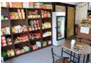
店内にはベトナムの食材や飲み物などが並ぶ