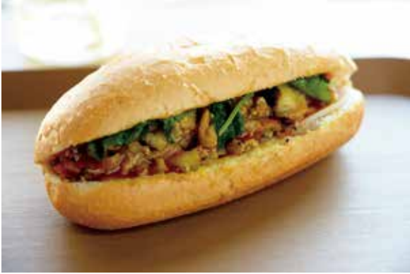
お店で一番人気のスペシャルバインミー

皆さんは「バインミー」という料理をご存知でしょうか？簡単にいうと、バインミーは、ハム、焼肉、野菜などをサクサクなフランスパンで挟んだベトナムのサンドイッチのこと。ベトナムでは屋台で気軽に買うことができるおなじみのファストフードです。