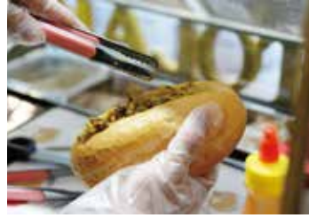
パテやソースもできるだけ 手作りにこだわっている

その一方で、バインミーの肝とも言えるサクサク食感が特長のフランスパンは、地元ではどうしても納得のいくものが手に入らず、わざわざ広島県にあるベトナムのパン屋さんから仕入れるというこだわりぶり。