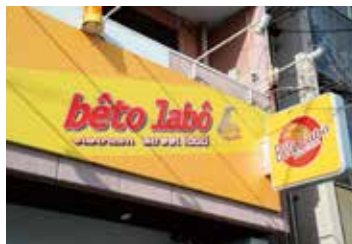
黄色い看板が目印

今治明德短期大学で学んだのち、外国人技能実習生などの受け入れをサポートする組合に就職し、約1年間今治市内で、その後約2年半は県外で働いたフーさん。そこでの任務は、日本と母国との文化や習慣などの違いからストレスやトラブルを生まないように、企業と実習生の間をつなぐこと。やりがいのある仕事でしたが、次第に、別の側面からベトナムと日本をつなぐ手伝いができないかと思い始め、飲食店を開業する夢を抱くようになったそうです。どこでお店をやるのか？と考え、その候補地として真っ先に思いついたのが、今治だったそう。来日して最初に住んだ今治が、フーさんにとって原点であり、大好きな町で新しいチャレンジをしたいと思ったそうです。