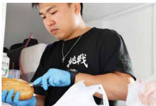
キッチンカーで出来立てのバインミーを提供