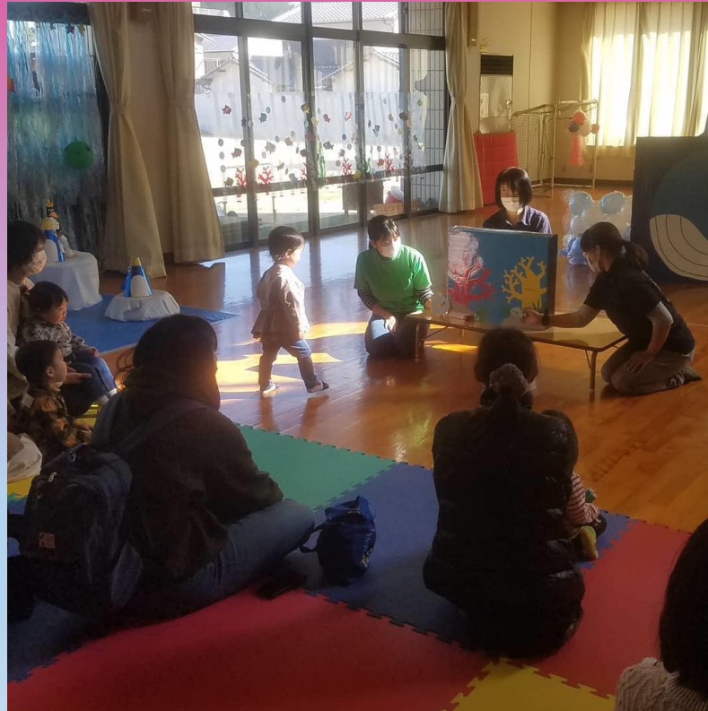
わくわくフェスタ