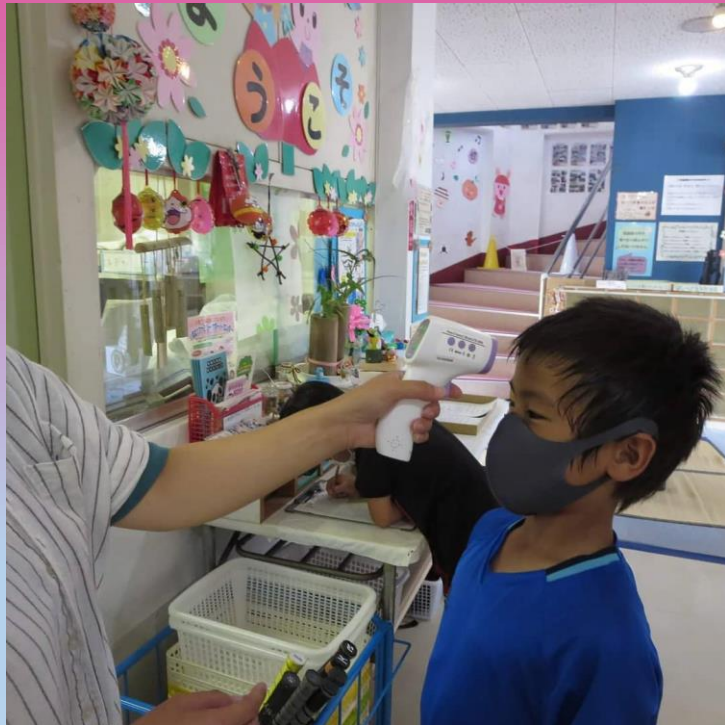
入館時の検温実施