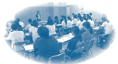
地域包括支援センター美須賀・立花 「ジュニア介護教室」