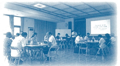
地域包括支援センター日吉・近見 「近見公民館で開催した地域ケア会議」

地域ケア会議には、高齢者の方が安心して暮らせる地域づくりを目指して、住民の方をはじめ、地域で活動している団体や、介護保険事業所、学校、警察、金融機関などが参加しています。地域で高齢者の方を支えるために、様々な立場から意見を出し合い、話し合いをすすめています。