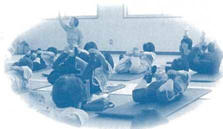
地域包括支援センター北郷・大西・菊間 「気楽にできる！健康ヨガ」