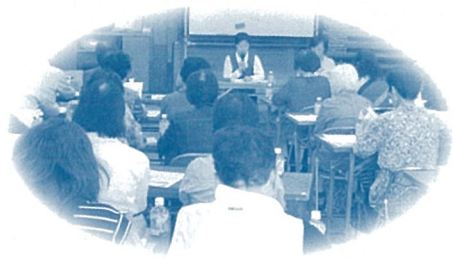
地域包括支援センター西・南 「高齢者の施設について」

在宅で介護しているご家族などを対象に、介護教室を開催しています。内容は、介護に関する知識や方法についての講義や実技、介護者の健康づくりや心身のリフレッシュ目的の体操教室、中高生を対象にした介護教室等様々です。