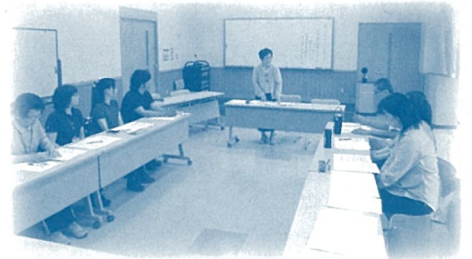
地域包括支援センター桜井・朝倉・玉川 「ケアマネジャー研修会」

皆さんが介護保険サービスを利用する場合、ケアマネジャー(介護支援専門員)は、一番の相談相手です。皆さんが安心して相談できるようケアマネジャーを支え、資質向上のための研修会等を行っています。