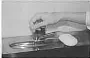
7. 水道の栓を止めるときは、手首が肘で止める。できないときは、ペーパータオルを使用して止める