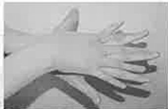
2. 手の甲を伸ばすように洗う