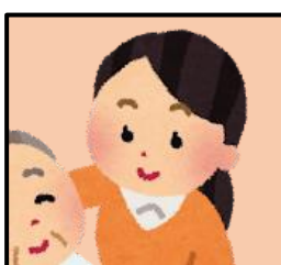
介護者(申請者) (介護をしている方)