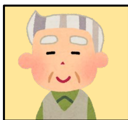
被介護者 (介護を受けている方)

介護用品支給事業の対象となるかどうか申請前に本確認シートでご確認ください。 これらの確認事項 全てに該当すれば 介護用品支給事業に申請していただけます。