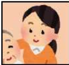
介護者(申請者) (介護をしている方)