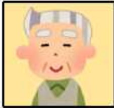
被介護者 (介護を受けている方)