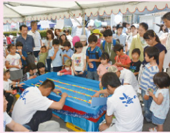
ポンポン船レース