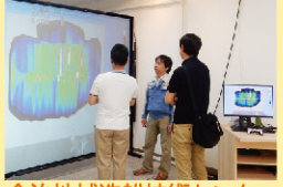
今治地域造船技術センター