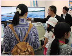
操船シュミレーター体験