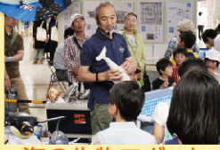
海の生物ロボット