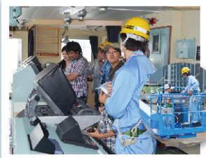
③檜垣造船波方工場