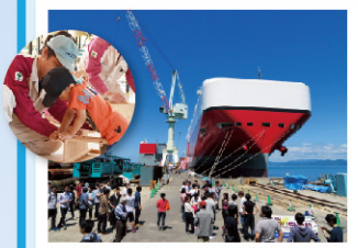
②新来島どっく大西工場