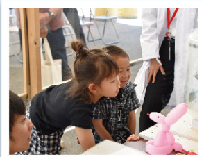
⑤潮冷熱新都市工場