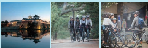
今治城 桜井サイクリングコース [志島ヶ原] 四国遍路 [市内6ヶ寺/仙遊寺]