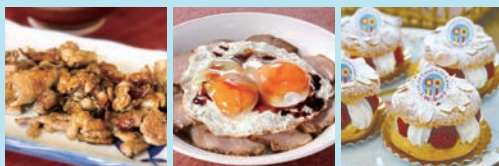
今治焼き鳥 [皮焼き] 今治焼豚玉子飯 今治ブレスト [パリブレスト]