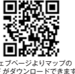
ウェブページよりマップのPDFがダウンロードできます

各店、臨時・長期休業や営業形態が変更になる場合があります。予めご了承の上、お電話や SNS などでご確認ください。