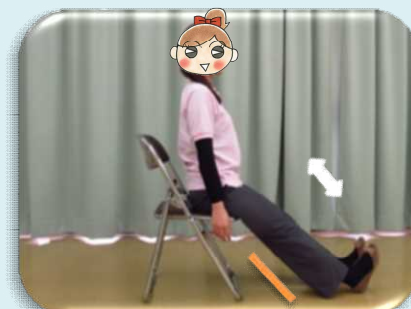
つま先上げ下ろし