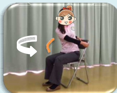
腰を左右にひねる