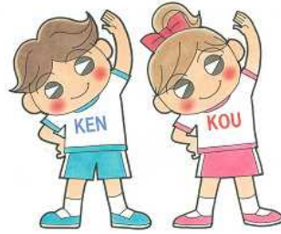
今治市健康づくり計画推進キャラクター ケンちゃん・コウちゃん