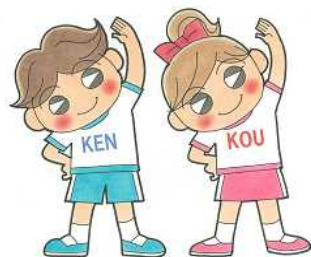
今治市健康づくり計画推進キャラクター ケンちゃん・コウちゃん