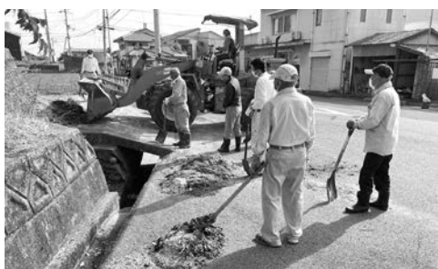
波方地区 水路の泥上げ