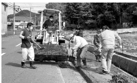
養老地区 道路側溝の土砂除去

恒例の町内一斉清掃が、4月25日に養老地区で、5月9日に波方、郷、宮崎地区で、5月16日樋口地区、30日西浦地区で、6月6日に馬刀潟地区で実施されました。