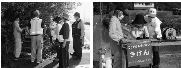
危険箇所の点検をする防犯協会玉川支部の皆さん

6月8日(火)、今治地区防犯協会玉川支部による水辺の危険箇所点検が行われました。水難事故から子どもたちを守るため赤い「きけん」旗の確認・設置等、念入りに行っていました。