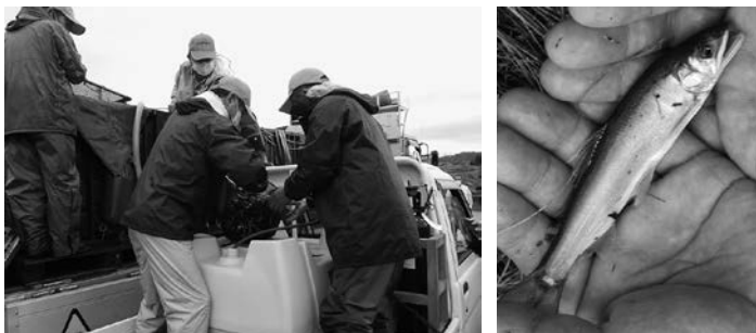
トラックの水槽からタンクに移されるアユの稚魚

5月21日(金)・6月4日(金)、アユの稚魚の放流が行われました。蒼社川漁業協同組合の皆さんの手により放流されたアユは元気いっぱい泳いでいました。