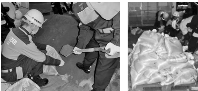
土のうを作成し、災害に備える団員（第1分団木浦）

6月11日(金)、伯方方面隊第1分団（木浦）の詰所前では、団員が約400個の土のうを作成し、既存のもの合わせて約800個を準備し、集中豪雨に備えました。