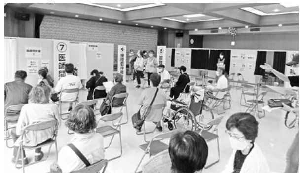
伯方公民館での集団接種の様子（6月26日）