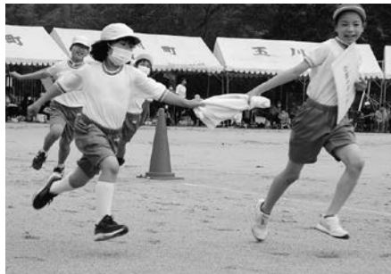
借り物・借り人競争