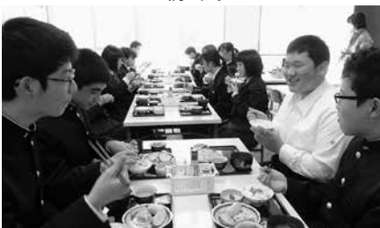
先生が交代でサポート