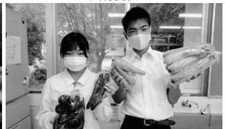
地域で採れた野菜