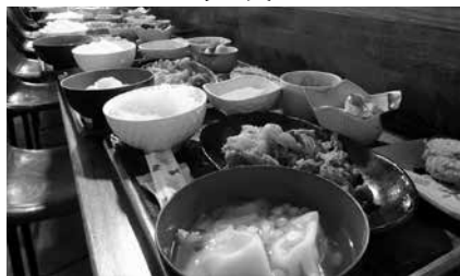
地域住民が交代で提供 上浦の飲食店・個人なども参加