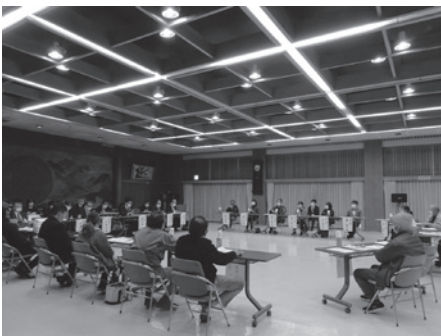
しまなみ海道実質無料化に向けたタウンミーティング

令和3年11月26日(金)、「市民が真ん中の視点」で市政運営を進めるため、市長が各支所に直接出向き、支所管内の地域住民の声を聴き意見交換をする「おでかけ市長室」が大三島公民館で開催されました。会議には地域を代表して連合自治会や地域活性化協議会など各種団体から15名が出席。参加者からは、「わがもの顔で堂々と町のなかを歩く野犬を何とかして欲しい。安心安全な大三島を」、「大三島の農産品の販売チャンネルを充実させ、わかりやすいPRをお願いしたい」、「大三島分校が1年でも長く存続できるよう継続した支援をお願いしたい」などの意見・要望が出されました。閉会あいさつで市長は、「改めて気づきや学びがあった貴重な会になった。これからも皆さんとともに、持続可能な大三島づくりに向けて邁進したい」と意気込みを語りました。また、同日「しまなみ海道実質無料化に向けたタウンミーティング」も、大三島・上浦両地域の各種団体から17名の出席をいただき開催されました。