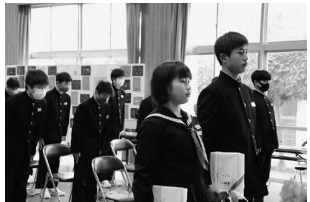
今治市とPTAからの記念品授与