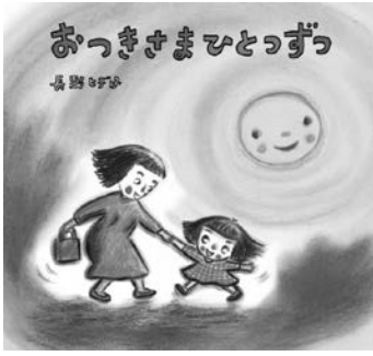
おつきさまひとつづつ 文・絵：長野 ヒデ子 (今治市出身) 出版社：童心社

開室時間 午前8時30分～午後5時まで (土・日曜日、祝・祭日を除く) 一人2冊まで 貸出期間 2週間まで