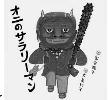
オニのサラリーマン 文：富安 陽子 絵：大島 妙子 出版社：福音館書店

ぽっかり月がでています。 小さいあこちゃんはおかさんと 手をつないでかえります。 心にのこる月夜のおはなしです。