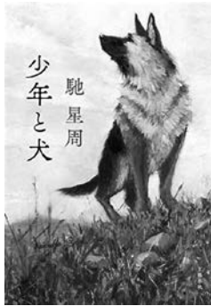
少年と犬 著者：馳 星周 出版社：文藝春秋

赤オニのオガサワラ・ケン、 地獄カンパニーの平社員。 今日も地獄へ出勤です。 怖いけどおかしい地獄の世界が テンポのいい関西弁で語られます。