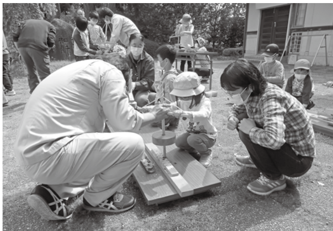
古代の「火おこし」に挑戦する隊員たち

また、天然の塩づくりも行われ、桜井海岸の海水を煮詰めて作った天然の塩を味見し、隊員たちは、現代の塩とは違う天然の塩の味わいを感じ、いにしえに思いをはせていました。