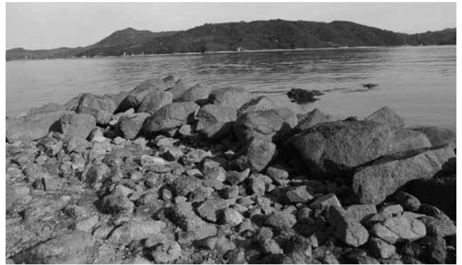
算木積の石垣跡 南側が状態良好で、算木積の石垣を確認できます。