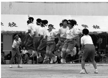
みんなでジャンプ