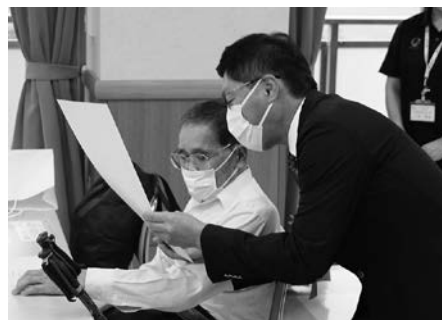
徳永市長から米寿証の授与

市長をはじめ、ご来賓の方々からお祝いの言葉をいただき、出席者の皆様も笑顔が絶えない微笑ましい敬老会となりました。