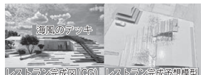
海風のデッキ レストラン完成図(CG) レストラン完成予想模型 完成予想図

詳しい事業内容についてはこちらから！ https://www.furusato-tax.jp/gcf/2091