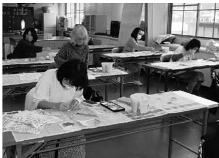
楽しみながら作成中