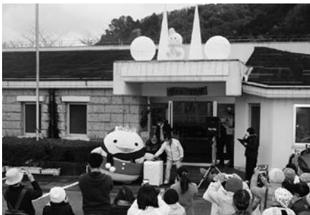
イルミネーション点灯!