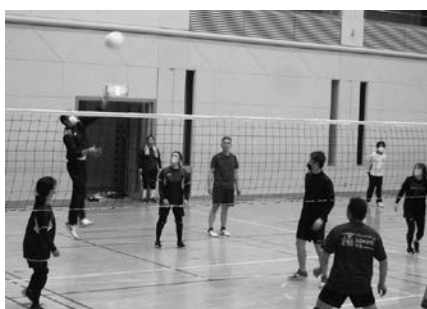
白熱した大会の様子

11月13日(日)、グリーンピア玉川と九和小学校体育館で、レクリエーションバレーボール大会が開催されました。9チームが参加し、随所に好プレーや珍プレーが見られ、熱戦が繰り広げられました。