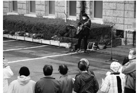
渡部住職による弾き語り