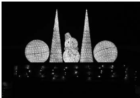
1月9日まで毎日(17:00~22:00)点灯しています。