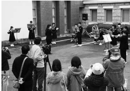
玉中吹奏楽部による演奏