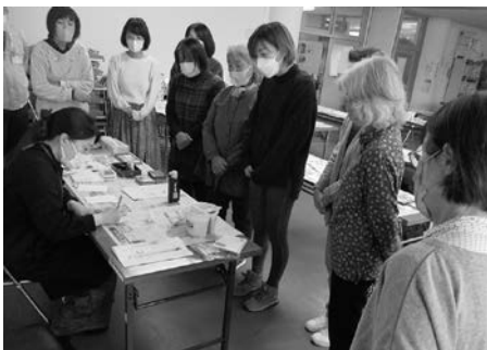
講師の作品に見入る参加者