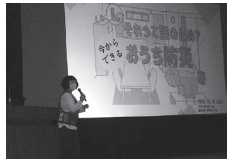
防災について講演