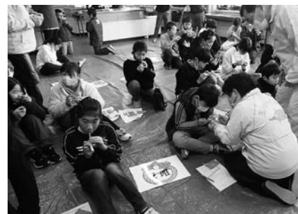
竹細工に夢中の小学生

令和4年12月27日(火)、玉川公民館で「ふるさと探検・伝々(でんでん)」が開催され、地域の小学生21人が参加しました。NPO法人玉川サイコーのスタッフを講師に、竹細工で竹トンボと竹笛作りを行なった後、ふるさとの民話で紙芝居や地域に伝わるお話を聞いたり、地域の良さや暮らしの書かれた大型のふるさとかるた取り大会を行いました。