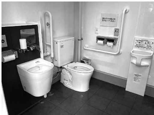
新設された多目的トイレ

昨年9月から行われていた大角海浜公園のシャワー棟の改修工事が、1月末で完了しました。現状の建物を残し屋根や外壁の塗装や内壁の一部改修し、建屋内に多目的トイレを新設し、未舗装部分を舗装して駐車場を新設しています。従前に比べかなり快適になりましたので、長く美しく維持できるよう大切に使用していただきますようお願いいたします。