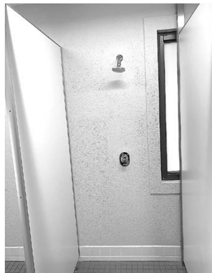
美しくなった内装部分