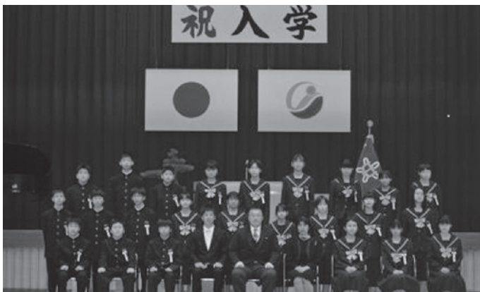
4月11日(火) 大三島中学校入学式

すっかり春の陽気となった4月、大三島小・中学校・今治北高等学校大三島分校で入学式が行われました。今回、新たに一步を踏み出したのは、大三島小学校12人、大三島中学校24人、今治北高等学校大三島分校31人でした。みんなそれぞれの期待を胸に新生活をスタートさせました。