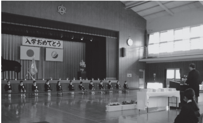
4月10日(月) 大三島小学校入学式