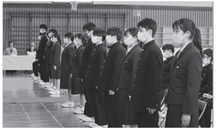
4月11日(火) 今治北高等学校大三島分校入学式

すっかり春の陽気となった4月、大三島小・中学校・今治北高等学校大三島分校で入学式が行われました。今回、新たに一步を踏み出したのは、大三島小学校12人、大三島中学校24人、今治北高等学校大三島分校31人でした。みんなそれぞれの期待を胸に新生活をスタートさせました。