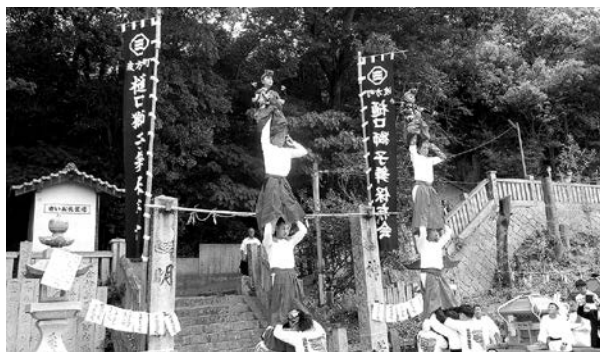
天に少しでも近くへ

5月28日(日)波方町各地域で、春の大祭が開催されました。この日は、宮出し前から多くの観客が集まり、久しぶりに復活した獅子舞や継獅子をよく見える場所に陣取りカメラなどで写真や動画を撮影していました。また、継獅子は何か月前からの練習をしていましたが、五継になると緊張している姿も見られました。当日は、快晴であったこともあり各地で遅くまで祭りを楽しんでいます。