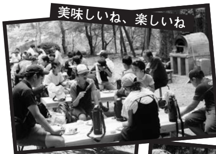
美味しいね、楽しいね

8月29日(火)、「ふるさと探検・伝々（でんでん）」が蒼社川（龍岡中村）で開催され、地域の小学児童25人が参加し、アユやアマゴのつかみどりを楽しみました。川遊びの後、自分たちでとった魚の塩焼きなど頬張り、満面の笑みで夏休みを満喫しました。