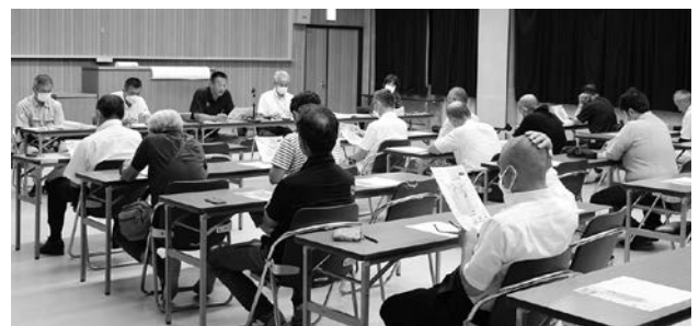
意見交換する各種団体代表者と正岡支所長

懇談会には、九和地区自治会長をはじめ各種団体の代表者が出席し、地域の現状と課題について意見交換しました。