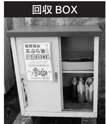
玉川支所正面玄関に設置