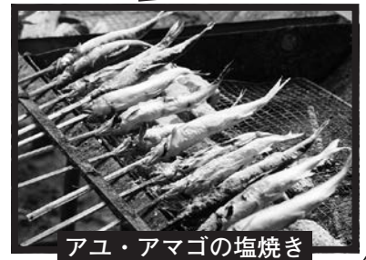
アユ・アマゴの塩焼き