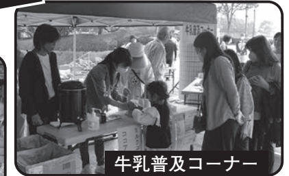
牛乳普及コーナー