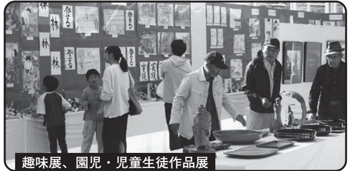
趣味展、園児・児童生徒作品展