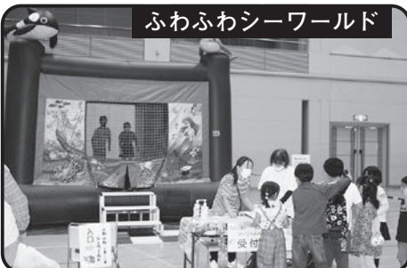
ふわふわシーワールド