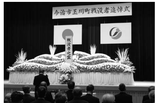
遺族会玉川支部長による「追悼の辞」

10月20日(金)、グリーンピア玉川大ホールで玉川町戦没者追悼式が挙行されました。式典では、黙祷を捧げた後、市長の式辞、今治市連合遺族会長をはじめ、来賓による追悼の辞が述べられました。参列者全員による献花が行われ、最後に玉川中学校三年生代表による平和への願いのビデオメッセージをいただき、戦没者のご冥福をお祈りしました。