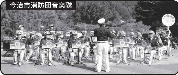
今治市消防団音楽隊

玉川の人の動き 令和5年10月末現在 人口(男) 2,112人 (女) 2,437人 計 4,549人 世帯数 2,216戸