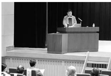
中城院長による講演