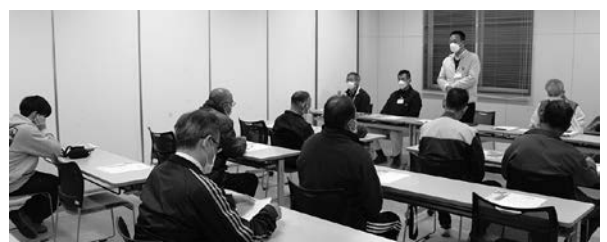
意見交換する各種団体代表者と正岡支所長

令和5年12月14日(木)、玉川支所長が住民の声を聴き意見交換する「おでかけ支所長室」が、龍岡中通の玉川艇庫で開催されました。懇談会には、龍岡地区自治会長をはじめ各種団体の代表者が出席し、地域の現状と課題について意見交換しました。