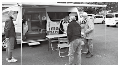
巡回に来た移動市役所に来所した住民

来所した住民は、「移動市役所」のサービス内容などを職員から説明を受けていました。「移動市役所」では、住民票や印鑑登録証明書の交付、マイナンバーカード新規申請、税・福祉などの担当課とのオンライン相談が利用可能となっておりますので、月2回の運行日にご利用ください。