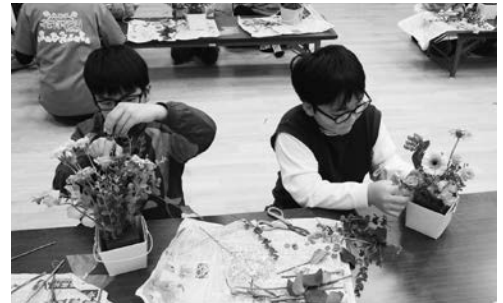
イメージを膨らませ、花をアレンジしている参加者

子どもたちにとって、このフラワーアートの体験が、生け花の大切さと創造力を育むいい機会となりました。