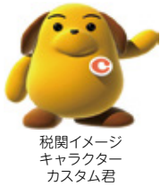
税関イメージキャラクターカスタム君

■問合先 密輸ダイヤル（24時間受付） TEL 0120-461-961 松山税関支署今治出張所 TEL 0898-23-0031